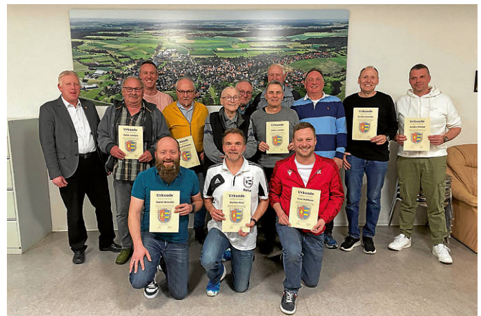
Das Bild zeigt die anwesenden geehrten Mitglieder

Die Mitgliederversammlung des HSV fand am Freitag,