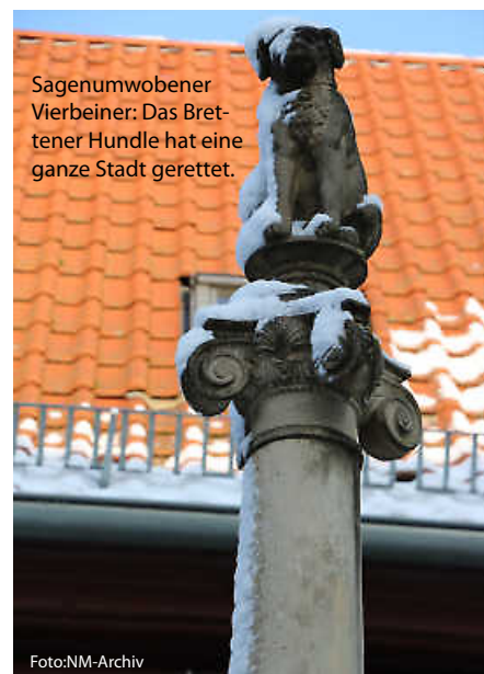
Sagenumwobener Vierbeiner: Das Brettener Hundle hat eine ganze Stadt gerettet.

Und da wäre noch die Geschichte vom Hexenbiss am Heidelberger Schloss, das älteste Musikinstrument der Welt oder auch die Antwort auf die wichtige Frage, warum Badener auch als „Gelbfüßler“ bezeichnet werden. Diese und noch viele andere spannende Anekdoten und Legenden zeigt unsere Rubrik „Unnützes Heimat-Wissen“ auf. (haf)