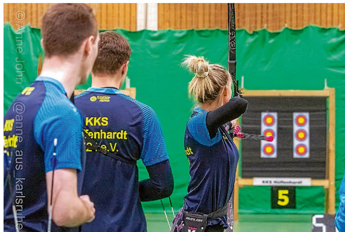
Bogenschützen des KKS am letzten Wettkampftag der Baden-Liga in Karlsruhe