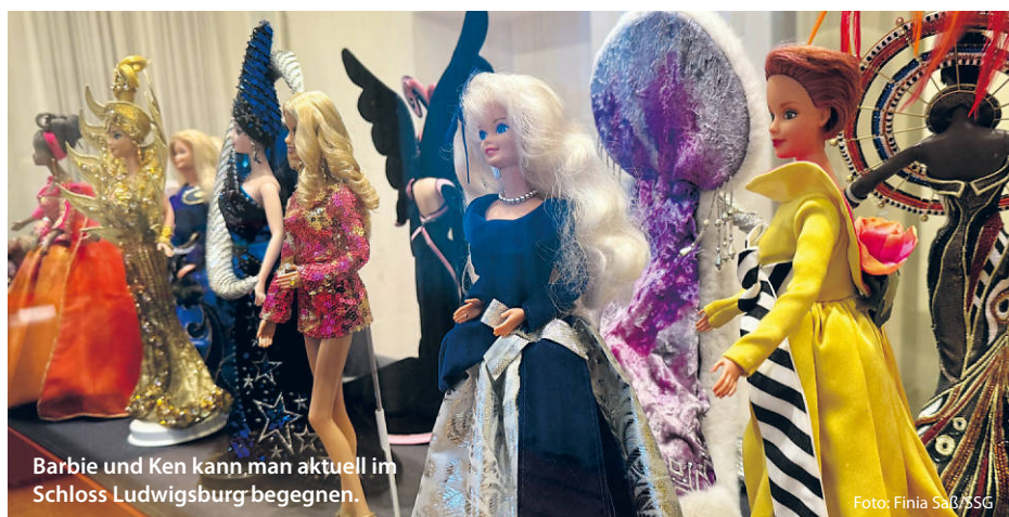
Barbie und Ken kann man aktuell im Schloss Ludwigsburg begegnen.

Jedes Museum bietet nicht nur Spaß für Kids, sondern sorgt auch bei den Älteren für eine kleine Atempause mit dem Gefühl: Hier wird unser Alltag erleichtert. Und das Beste? Viele dieser Einrichtungen haben familienfreundliche Eintrittspreise. Perfekt für einen vollen Tag – ohne, dass am Abend der Geldbeutel stöhnt. Fertig sind 10 Abenteuer, die Lust machen, neue Welten zu entdecken. Also: Wer packt den Rucksack? (ral/jr/red)