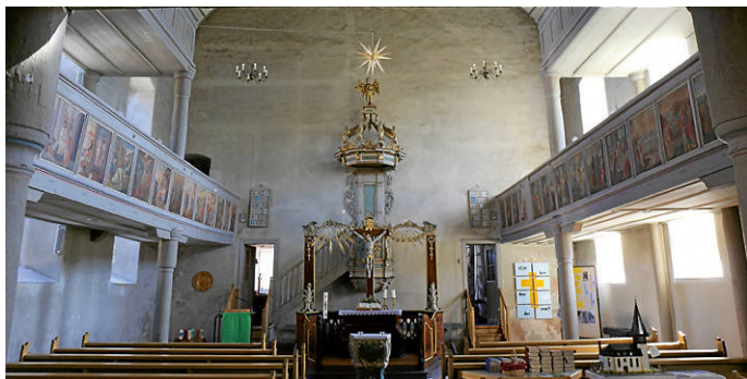
Blick in den Kirchenraum mit Altar und Kanzel

Ziel unseres Förderkreises Kulturkirche ist es, unsere evangelische Dorfkirche zu erhalten. Dazu können Sie zum Jahreswechsel einen Beitrag leisten und unseren Kalender für das Jahr 2026 kaufen. Vielleicht möchten Sie ihn auch gerne verschenken? Die Aufnahmen von Claudia Weber zeigen die kleinen und großen Kostbarkeiten in unserer Kirche und nehmen ihre Schönheit in den Blick, ohne die Spuren der Zeit zu verbergen. Der Kalender ist zu den Gottesdienstzeiten im Gemeindehaus zu haben und kostet 20 Euro. Wir freuen uns, wenn Sie den Förderkreis auf diesem Weg unterstützen. Bei Fragen: Tel. 0172/9125080.