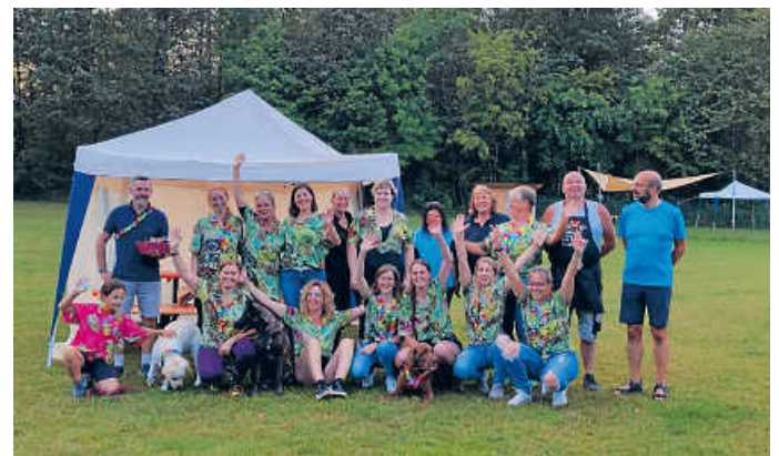
Helfer des Aloha-Cups