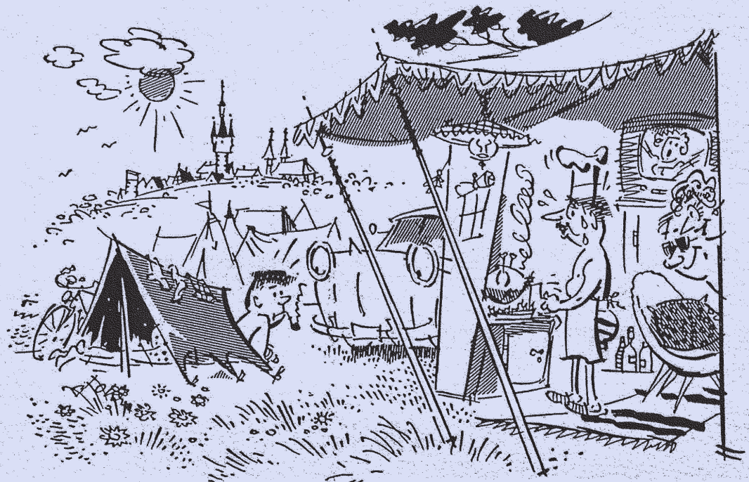
Zeichnung: Edgar John

... bitte denken Sie an Ihre gültigen Dokumente.