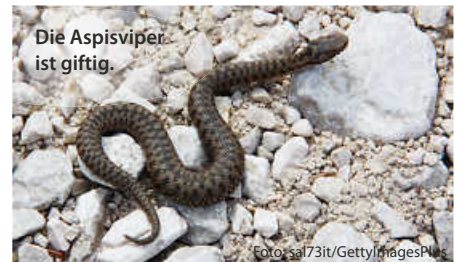
Die Aspiviper ist giftig.