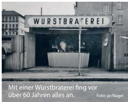
Mit einer Wurstbraterei fing vor über 60 Jahren alles an.

Der Überlieferung nach soll 1948 bereits die erste gebratene Wurst aus dem Hause