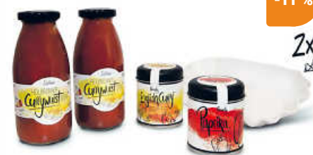
Unser Tipp: Geschenkbox 'Duo' - Heilbronner Currywurstsoße

Ältesten in Heilbronn“. Er ist an seinem festen Standort mit Biergarten in Schozach Bahnhöfe zu finden, zudem ist man aber nach wie vor auch mit mobilen Hütten auf Traditionsfesten in und um Heilbronn unterwegs. Und wer da nicht hinkommt, kann zumindest die Sauce auch für Zuhause online bestellen. (haf/jr)