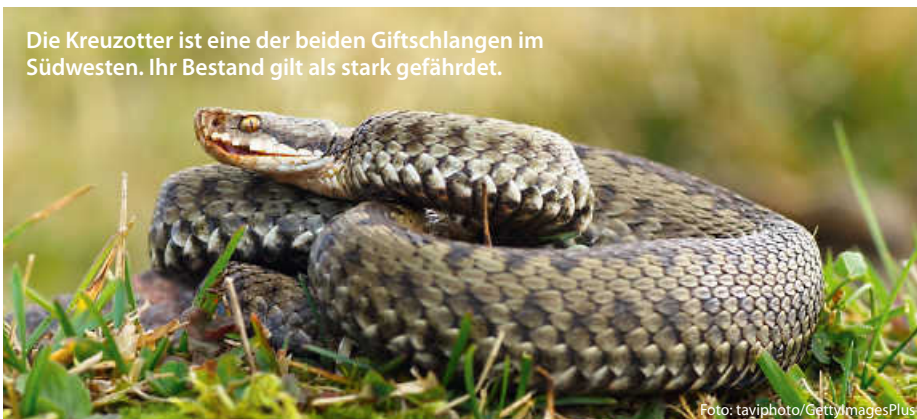
Die Kreuzotter ist eine der beiden Giftschlangen im Südwesten. Ihr Bestand gilt als stark gefährdet.