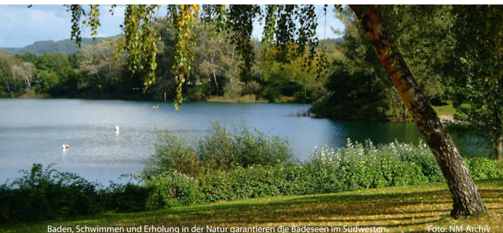
Baden, Schwimmen und Erholung in der Natur garantieren die Badeseen im Südwesten.

Ein Sprung vom 10-Meter-Turm, mit Turbogeschwindigkeit die Wasserrutsche runter oder erste Schwimmversuche im Babybecken – ein Besuch im Freibad heißt Spaß für die ganze Familie. Und auch hier muss man auf gute Wasserqualität nicht verzichten. So badet man beispielsweise im Freibad Neuenbürg in herrlich weichem Quellwasser von hervorragender Qualität. Die waldreiche Umgebung schafft zudem eine ansprechende und natürliche Atmosphäre. (dk/fm)