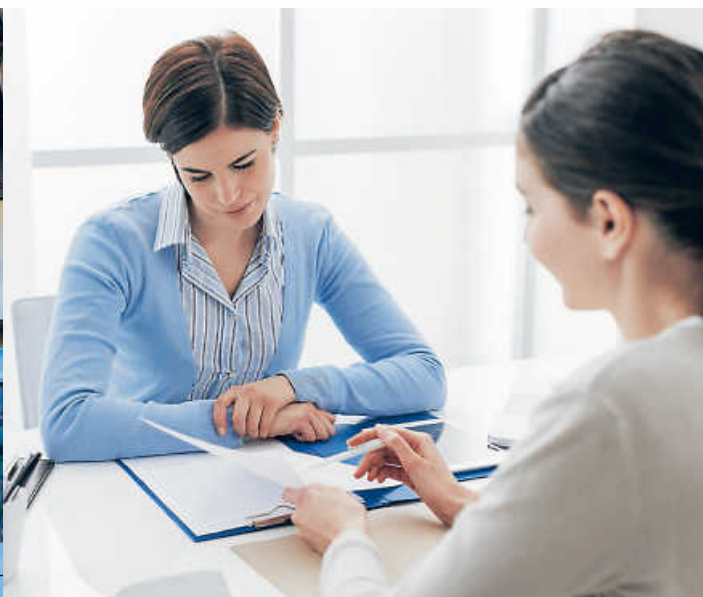
Sei es im Bürgerbüro oder bei der Wirtschaftsförderung – Verwaltungsangestellte sind oft die ersten Ansprechpartner für die Bürger.

Bei der digitalen Ausbildungs- und Jobmesse Karriere BW von Nussbaum Medien am Freitag, 1. Juli, wird auch das vielfältige Tätigkeitsfeld der Verwaltungsfachangestellten beleuchtet.